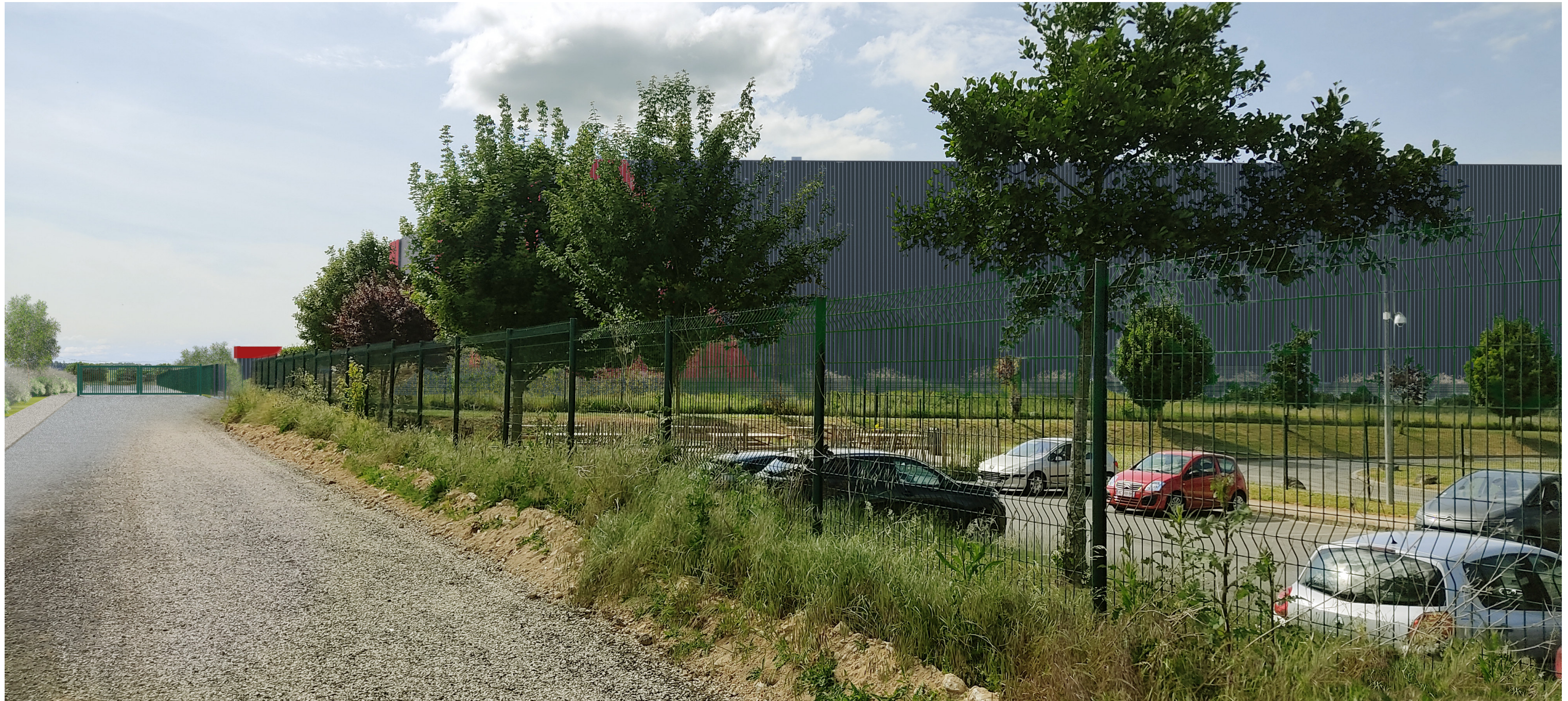
VUE A L'ENTREE DU SITE